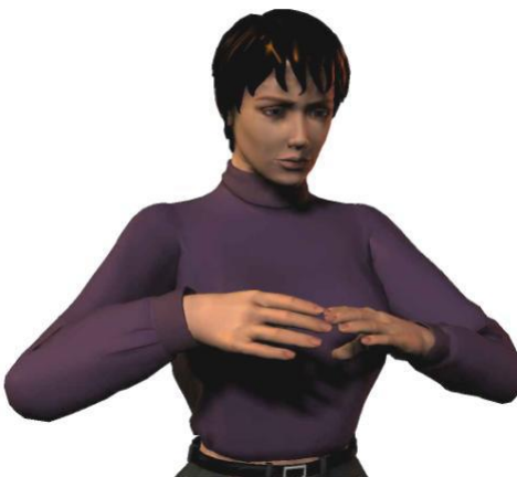
Optimale werkhogte voor knippen: tussen borst en schouderhoogte

De kapper verricht bij het werken aan de pompstoel de vaktechnische handelingen tussen borst en schouderhoogte met de schouders én ellebogen ontspannen laag hangend. Bij uitzondering mag de kapper hoger (tot ooghoogte) knippen.